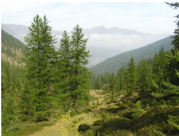
▲ L'itinerario di salita tra larici e rododendri

Il sentiero prosegue ancora in destra orografica, superando il rio del Gran Chiot, tra radure e larici sparsi. In tarda primavera accompagna la salita la fioritura dei rododendri, mentre in stagione più avanzata si trovano mirtilli e laricini.