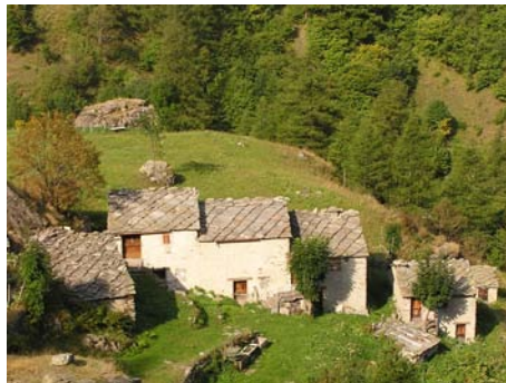
Case Giaven ►