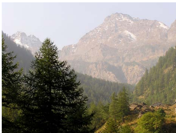
▲ Valle dei Carbonieri

Alleggi in loco: Alpe La Gianna, Grange La Gianna, Grange del Pis.