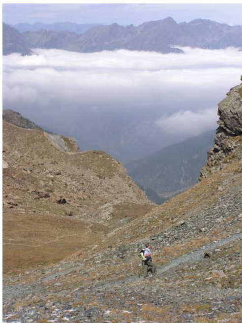
▲Ultimi passi verso il Colle della Gianna

La Vallata dei Carbonieri, così denominata per l'attività che vi veniva svolta (vedi inserto), è oggi percorsa da una strada che permette comodamente di risalirla seguendo il corso spettacolare del torrente senza peraltro cancellarne l'aspetto selvaggio.